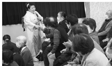
高齢者健康生きがいづくり事業