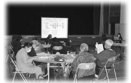
座談会の様子（若美地区）