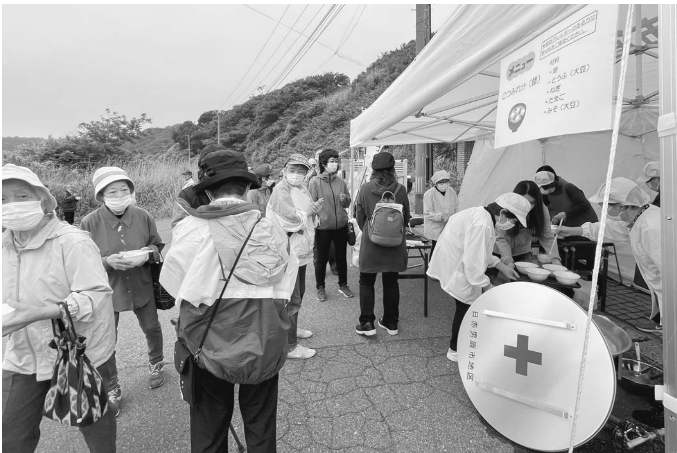
地元住民による炊き出し (戸賀コミュニティセンター前)

5月24日(金)戸賀地区を会場に、男鹿市総合防災訓練が行われました。元日に地震が発生した能登半島と男鹿半島は地理的条件が似ており、道路の寸断等により集落が孤立する可能性があります。自然災害は何時どこで発生するかわかりません。いざという時に迅速な行動がとれるよう、平時より避難場所や連絡手段等について考えておくことが大切です。今一度、確認してみましょう。