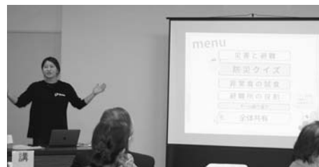
地域福祉トータルケア（防災講座）