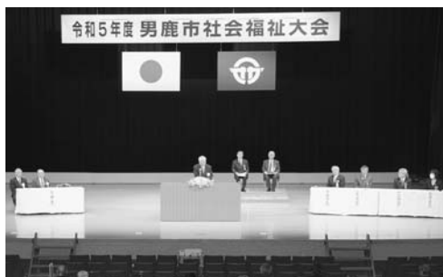
男鹿市社会福祉大会