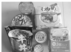
フードバンク事業