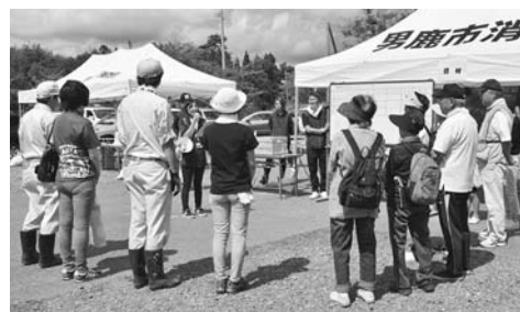
災害ボランティアセンター設置運営訓練