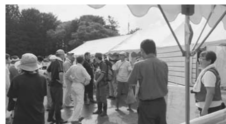
災害ボランティアセンター後方支援