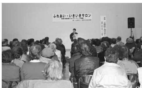
高齢者健康生きがいづくり事業