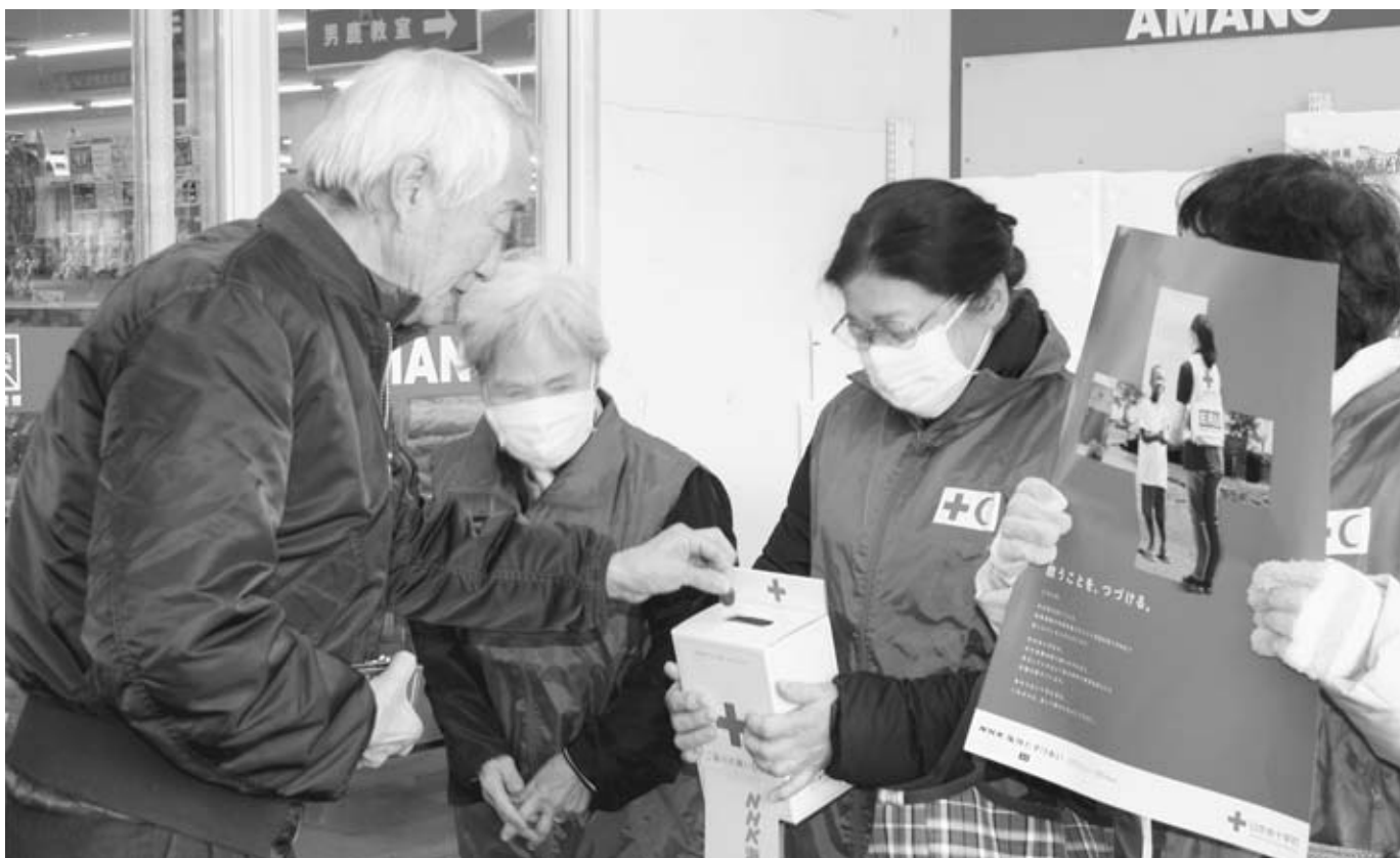
NHK 海外たすけあい街頭募金

12月7日、スーパーセンターアマノ男鹿店で赤十字奉仕団船越地区6名の皆さんが「NHK海外たすけあい」街頭募金を行い18,379円の募金が寄せられました。皆様から寄せられました募金は、日本赤十字社を通し、戦争や紛争或いは、自然災害の被災者救援などの緊急支援事業や飢餓や疾病に苦しむ人々への支援などの開発協力事業の充実・発展に役立てられます。沢山の皆様からの温かい気持ちありがとうございました。